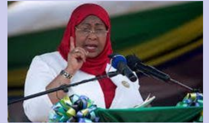
Makamu wa Rais Mh. Samia Suluhu Hassan

Mwenyezi Mungu akuzidishie maisha marefu wewe na serikali yako , “Mungu ibariki Tanzania “