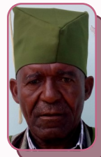
Mhe. Abeid Boki Diwani Kata ya Bolisa