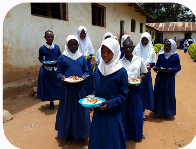
Wanafunzi wa Shule ya Msingi Iboni wakitoka kuchukua chakula cha mchana kinachotolewa kwa wanafunzi wote shuleni hapo