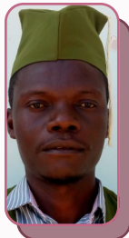
Mhe. Kipaya Mdachi Diwani kata ya Chemchem