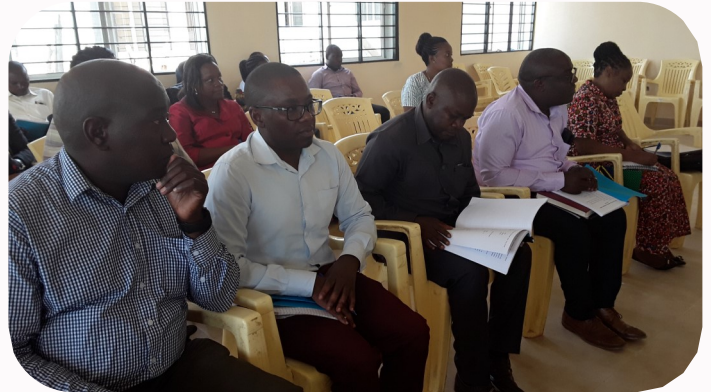
Wakuu wa Idara wakifuatilia baraza la kupitisha bajeti ya mwaka 2021/2022