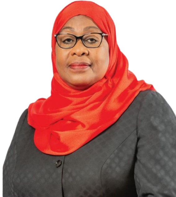
Mhe. Samia Suluhu Hassan Rais wa Jamhuri ya Muungano wa Tanzania