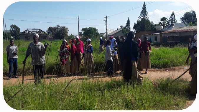
Wanafunzi wa Shule ya Sekondari ULA wakiwa wameshikilia miche ya miti kwa ajili ya kuipanda katika uwanja wa puma .