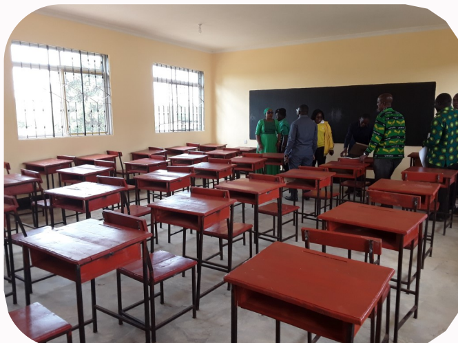
Kamati ya Siasa mkoa ikikagua madawati Shue ya Sekondari ULA