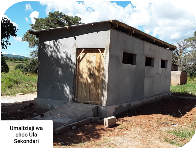
Umaliziji wa choo Ula Sekondari