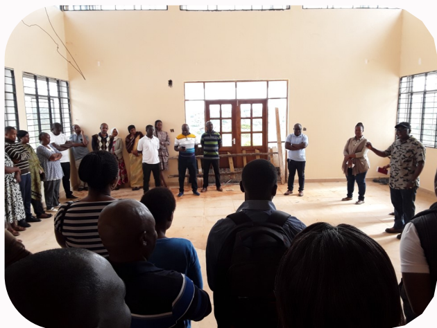
Mkurugenzi akitoa maelekezo kwa watumishi kabla ya kuanza kwa zoezi la ukusanyaji wa mapato ya vibali vya ujenzi