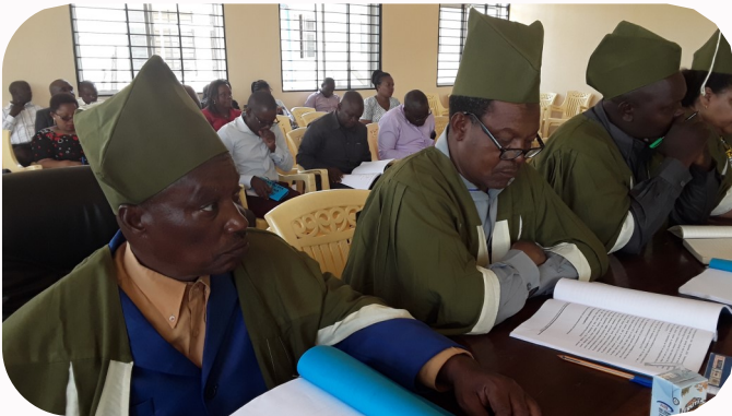
Wahe. Madiwani wakifuatilia baraza la kujadili bajeti ya mwaka 2021/2022