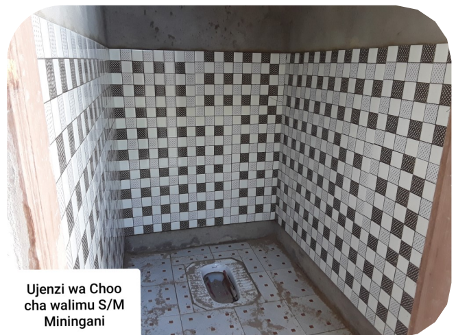
Ujenzi wa Choo cha walimu S/M Miringani