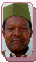
Mhe. Issa Kambi Diwani Kata ya Kilimani