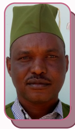
Mhe. Abushehe Mbuva Diwani Kata ya Kingale