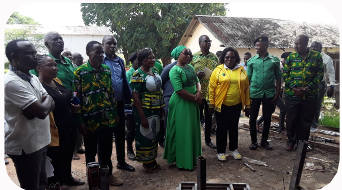
Kamati ya siasa mkoa ikiongea na mafundi waliokuwa wakitengeneza madawati (hawapo pichani) wakati wa ziara ya kuka-gua miradi ya maendeleo wilayani Kondoa ikiwa ni sehemu ya maadhimisho siku ya kuzaliwa kwa Chama Cha Mapinduzi.