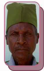
Mhe. Ally Modu Diwani Kata ya Suruke