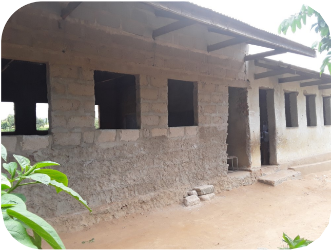
Madarasa katika Shule ya Msingi Maji ya Shamba kabla na baada ya ukarabati