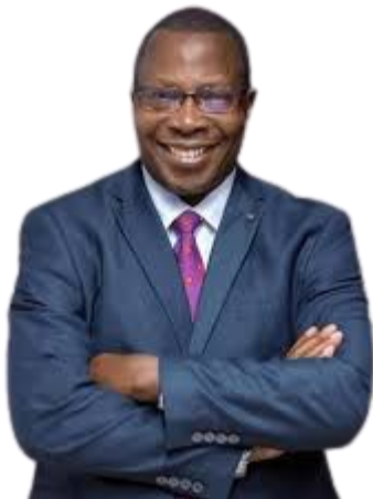
Dkt. Philip Isdory Mpango Makamu wa Rais Jamhuri ya Muungano wa Tanzania