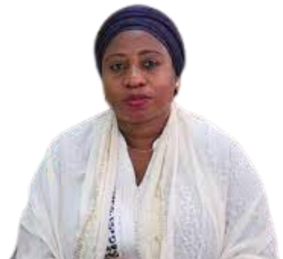
Mhe. Umyy Mwalimu Waziri wa OR - TAMISEMI