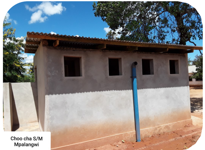
Choo cha S/M Mpalangwi