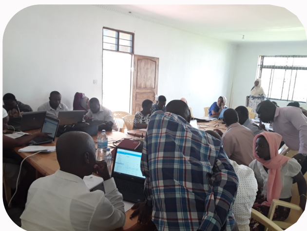
Idara Wahasibu wa shule, vituo vya afya wakifanya usuluhishi wa hesabu za vituo vyao ikiwa ni mafunzo yaliyoandaliwa na Idara ya fedha ili kubaini changamoto na kuzitatua kwa pamoja