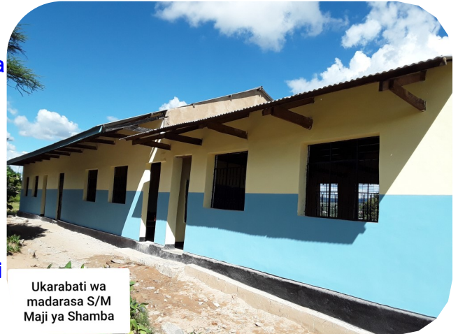
Ukarabati wa madarasa S/M Maji ya Shamba