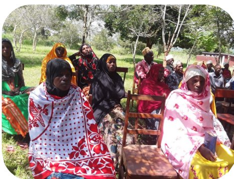
Baadhi ya wazazi waliojitokeza kwenye mkutano